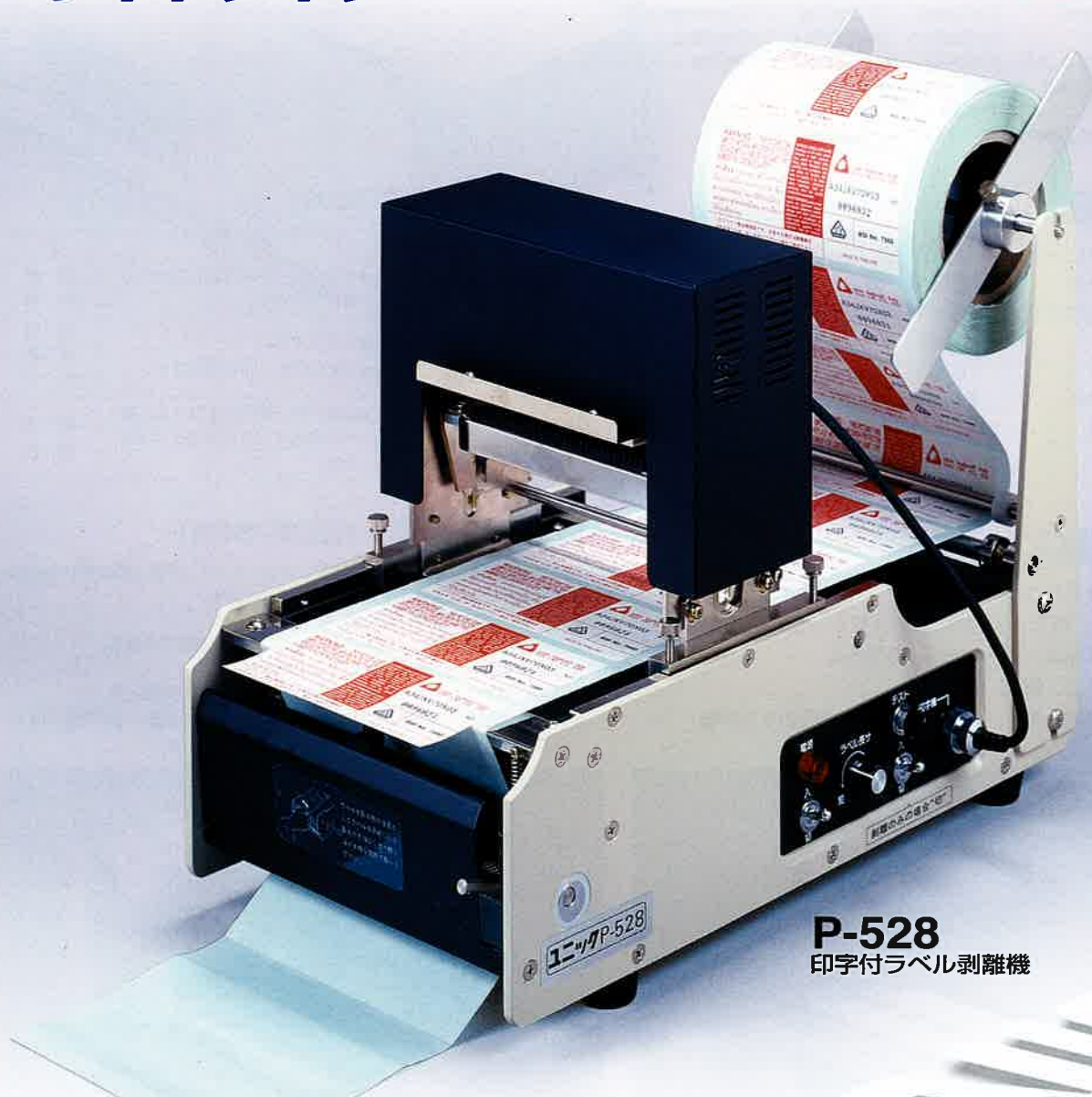
P-528 印字付ラベル剥離機

P-150 P-300 P-324 P-324RS P-362 P-362RS P-500 P-528 P-562 P-600 P-800 CP-4